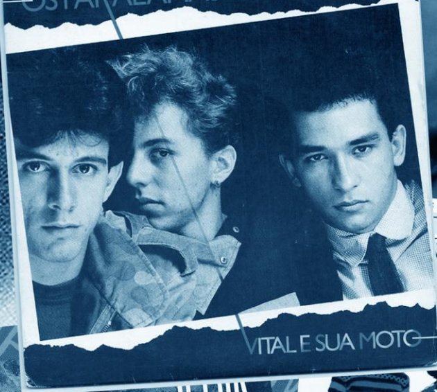
VITAL E SUA MOTOCICL