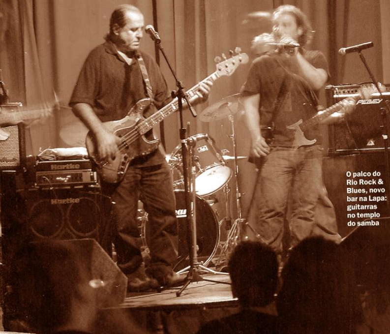
O palco do Rio Rock & Blues, novo bar na Lapa: guitarras no templo do samba

20 | 5 DE OUTUBRO DE 2006 • O GLOBO • BARRA